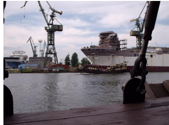
I baggrunden kan lige anes skibet

På sådan en bytur, dem havde vi nu mange af, for det er svært at blive færdig med at se byen. Dels er den, som før omtalt, fantastisk flot, og en stemning af ro og fred, hersker her, så man slapper bare af, og afstresser helt naturligt.