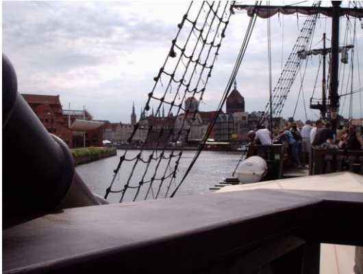
På tur med "black pearl"