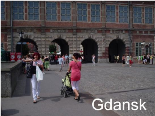
Portene fra havnefronten ind til byen