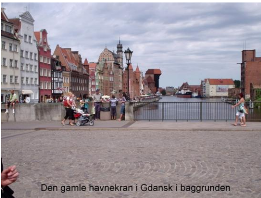
Den gamle havnekran i Gdansk i baggrunden

I Gdansk som lever meget af turister, er priserne lidt højere, men stadig i den billige ende. Men som i mange andre større byer, er der også de rigtig dyre spisesteder. Gdansk er en havne og værftby, og det meste af havnen inde ved byen, er omdannet til cafeer, spisesteder, og turistbutikker. Lidt længere ude fra byen blomstrer dog de store skibsværfter, og dominerer det hele. Herude er det ikke kønt, det roder og gammelt skibsaffald ligger i bunker i området.