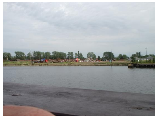
Et af mange værft