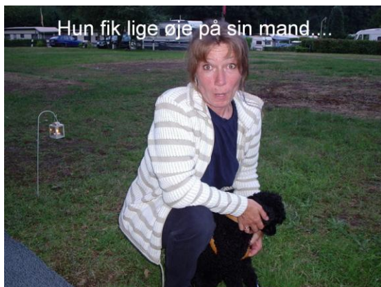
Hun har dog siden vænnet sig til mig.

Det så sådan ud da Sanne, sådan kom til at se rigtigt på mig.